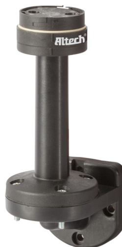
Soporte para montaje en pared, plástico