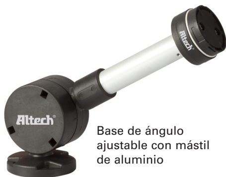
Base de ángulo ajustable con mástil de aluminio